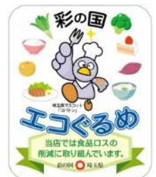
「彩の国エコぐるめ」協力店の登録証

小盛りメニューの設定や、量り売りなど、食品ごみの削減に取り組まれている事業者を登録、事業者にはステッカーを配布し、ホームページで紹介しています。